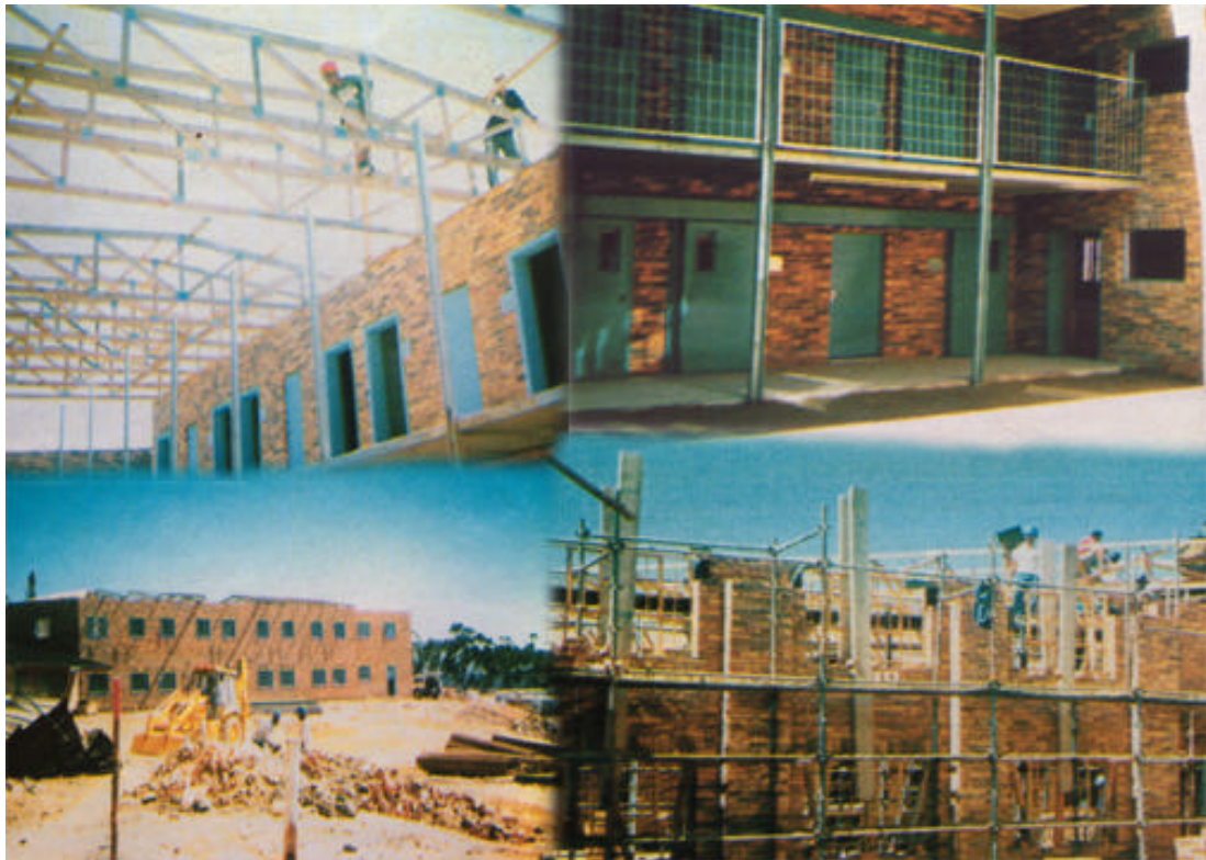
FIGUUR 36: Malmesburygevangenis in aanbou

Figuur 36 toon enkele foto's wat geneem is tydens die konstruksie van Malmesburygevangenis (Nexus, Julie 1997 : 16).