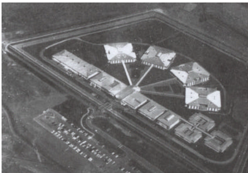
FIGUUR 37: Eenheidsbestuurs-gevangenis

Figuur 37 toon 'n bo-aansig van so 'n gevangenis.